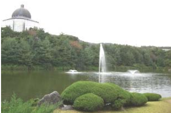
湖西大学校アサンキャンパス